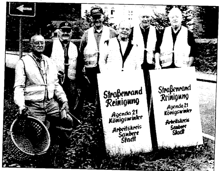
Säuberungsaktion zwischen Heisterbacherrott und Heisterbach.

In der Rotunde des Gästehauses auf dem Petersberg wurde das dritte Rhein-Sieg-Kammermusikfestival der „Klassik-Bühne Rhein-Sieg“ mit einem grandiosen Konzert eröffnet. Vor sieben Jahren wurde diese Konzertreihe von der Sparkassenstiftung gegründet mit dem Zweck, das kulturelle Leben in den Städten und Gemeinden zu fördern. Beim Eröffnungskonzert kamen Meisterwerke von Schumann, Unger und Brahms zu Gehör. Die Spenden gehen in diesem Jahr an die Aids-Hilfe.